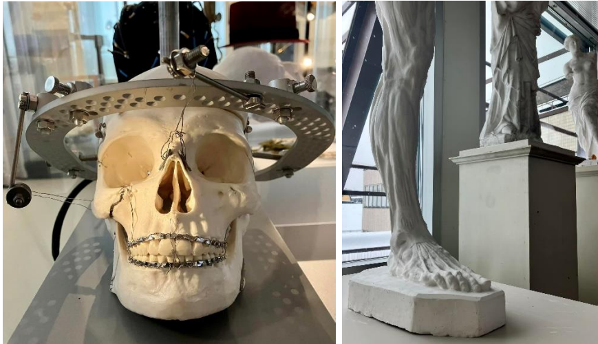
Kuva 1 – Tieteen palo-näyttelyn esineistöä. Kuva 2 – Piirustussalin veistostaidetta.

Kiitokset Miia-Leena Tiilille ja kaikille Liekin osallistujille!